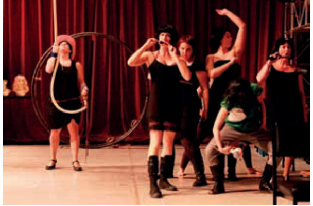
© Cirque de femmes en tout genre